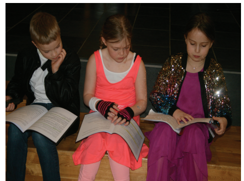
Mynd frá söngleikjaæfingu í 3. bekk

Að vera börnum sínum góð fyrirmynd í umferðinni er öflugasta fræðslan ásamt því að kenna þeim um lög og reglur sem eru í gildi.