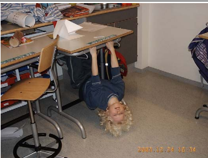
Ýmislegt gert til að láta sér liða vel í skólanum !!